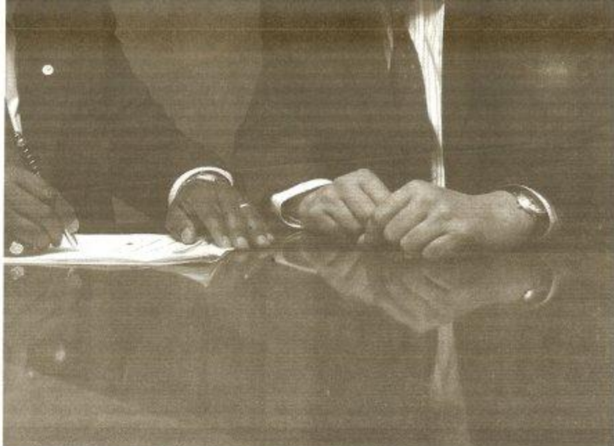
En rachetant Mercure.com, Ténor a joué le rôle d'intermédiaire.